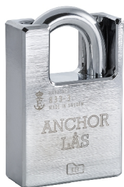
Även tillgänglig i inskyddat utförande (IB)