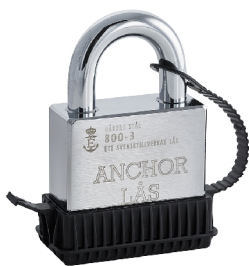
Även tillgänglig i väderskyddat utförande (WP)