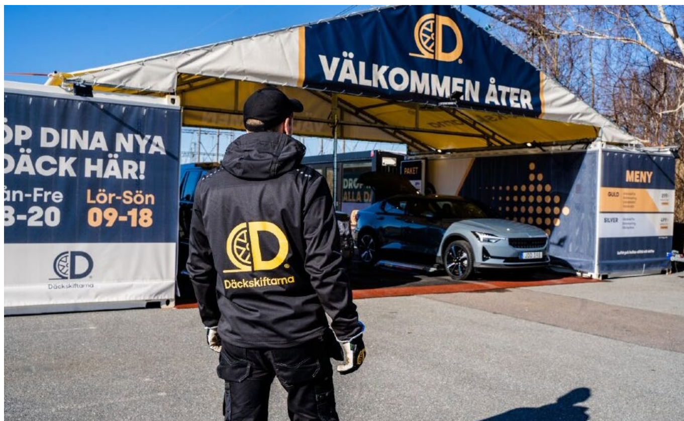
Däckskiftarnas mobila pop up-anläggningar för däckbyte som finns där kunderna finns.